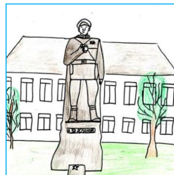
Рис. 2. – рисунки учащихся

Педагог: Молодцы, ребята! Вы хорошо представили в работах наш город, а давайте вспомним историю нашего города.