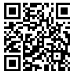
Рис. 1. – QR-код на видеоролик

Педагог: Все эти слова отражают наше отношение к Родине. Давайте посмотрим, какой красивый и благоустроенный наш город, какие трудолюбивые и творческие люди в нем живут.