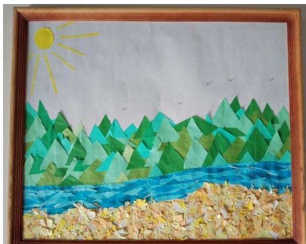
Фото 2. – коллективная творческая работа учащихся