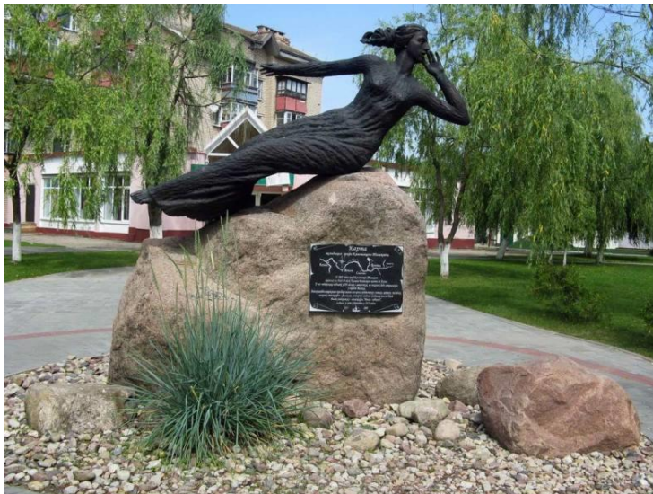
Фото 1. – памятник Вильяне возле городского парка

Вилейчане помнят легенду и установили каменный символ города – девушку Вильяну (фото 1).